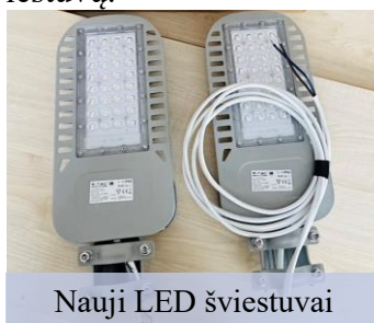
Nauji LED šviestuvai