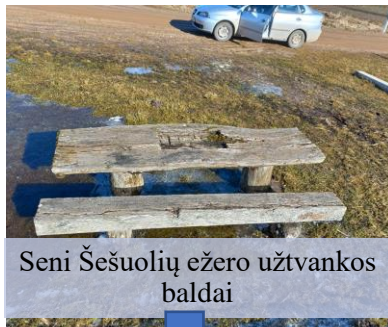
Seni Šešuolių ežero užtvankos baldai