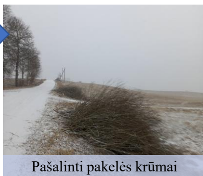
Pašalinti pakelės krūmai