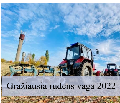
Gražiausia rudens vaga 2022