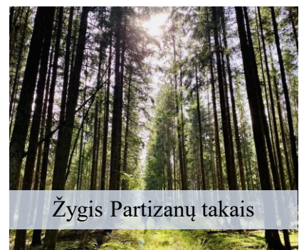
Žygis Partizanų takais