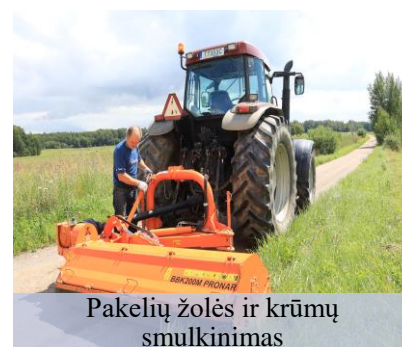
Pakelių žolės ir krūmų smulkinimas

Igyvendinant kaimo plėtros programą buvo organizuojama kultūros namų ir bibliotekų ūkinė veikla, remontuojama ir atnaujinama aplinkos tvarkymo technika, prižiūrimi nenaudojami pastatai ir jų aplinka, prižiūrimos kapinės, komunalinių atliekų surinkimo aikštelės, organizuotas šiferio ir padangų išvežimas, prižiūrimi pėsčiųjų takai, vejos, vaikų žaidimų aikštelės, šiltnamyje auginami gėlių daigai, paruoštos malkos seniūnijos ir kultūros namų 2022-2023 metų kūrenimo sezonui, organizuotas visuomenei naudingos veiklos atlikimas.