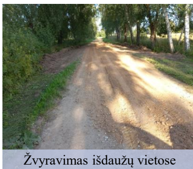
Žvyravimas išdaužų vietose