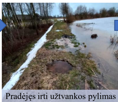
Pradėjęs irti užtvankos pylimas