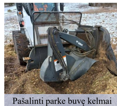
Pašalinti parke buvę kelmai