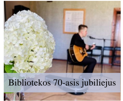
Bibliotekos 70-asis jubiliejus