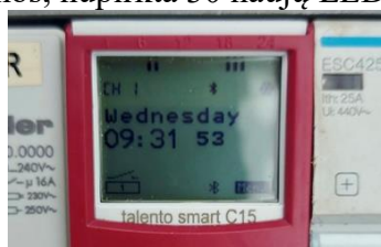
Išmani gatvių apšvietimo laiko nustatymo sistema

2022 metais gatvių apšvietimo laiko reguliavimui įdiegtos išmanios laiko nustatymo sistemos, nupirkta 30 naujų LED šviestuvų.