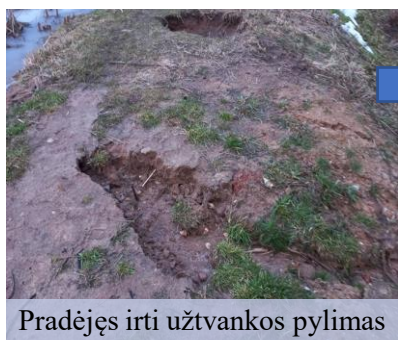
Pradėjęs irti užtvankos pylimas