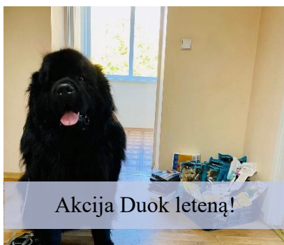
Akcija Duok leteną!