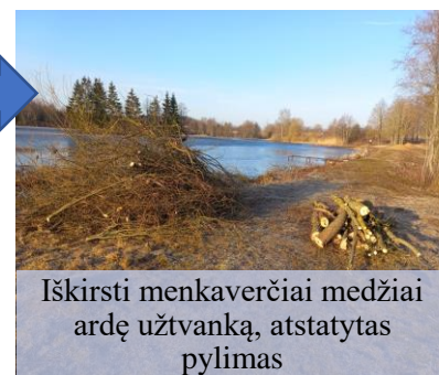
Iškirsti menkaverčiai medžiai ardę užtvanką, atstatytas pylimas