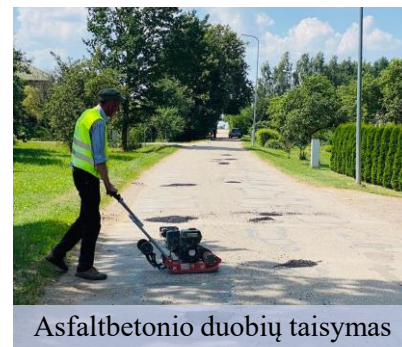
Asfaltbetonio duobių taisymas