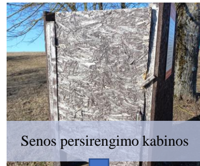
Senos persirengimo kabinos