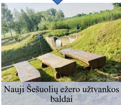
Nauji Šešuolių ežero užtvankos baldai