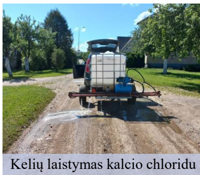
Kelių laistymas kalcio chloridu