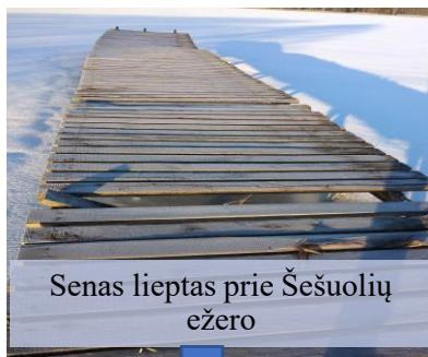
Senas lieptas prie Šešuolių ežero