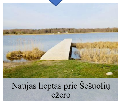
Naujas lieptas prie Šešuolių ežero