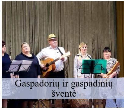
Gaspadorių ir gaspadinių šventė