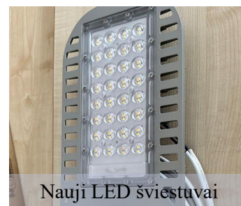
Nauji LED šviestuvai