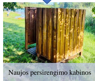
Naujos persirengimo kabinos