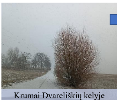
Krumai Dvareliškių kelyje