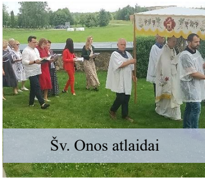
Šv. Onos atšaidai