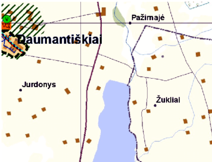
Ukmergės rajono savivaldybės vandens tiekimo ir nuotekų tvarkymo infrastruktūros ir plėtros specialiojo plano fragmentas.

Formuojamoje užstatymo teritorijoje nuotekų šalinimas bus sprendžiamas rengiant techninius projektus, vadovaujantis nuotekų tvarkymo reglamentais. Nuotekų šalinimo būdas turi būti parenkamas taip, kad jų neigiamas poveikis aplinkai būtų kiek įmanoma mažesnis. Nuotekų surinkimo sistema turi atitikti planuojamų tvarkyti nuotekų kiekybines ir kokybines charakteristikas.