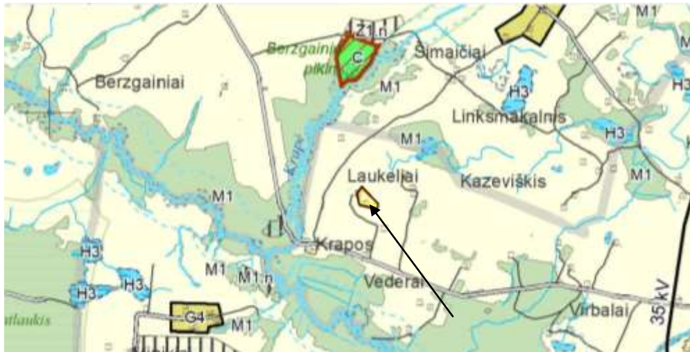
1 pav. Ištrauka iš Ukmergės sav. teritorijos bendrojo plano

Pagal Ukmergės savivaldybės bendrąjį planą, formuojama teritorija patenka į Ž.1 zoną – žemės ūkio teritorijos.