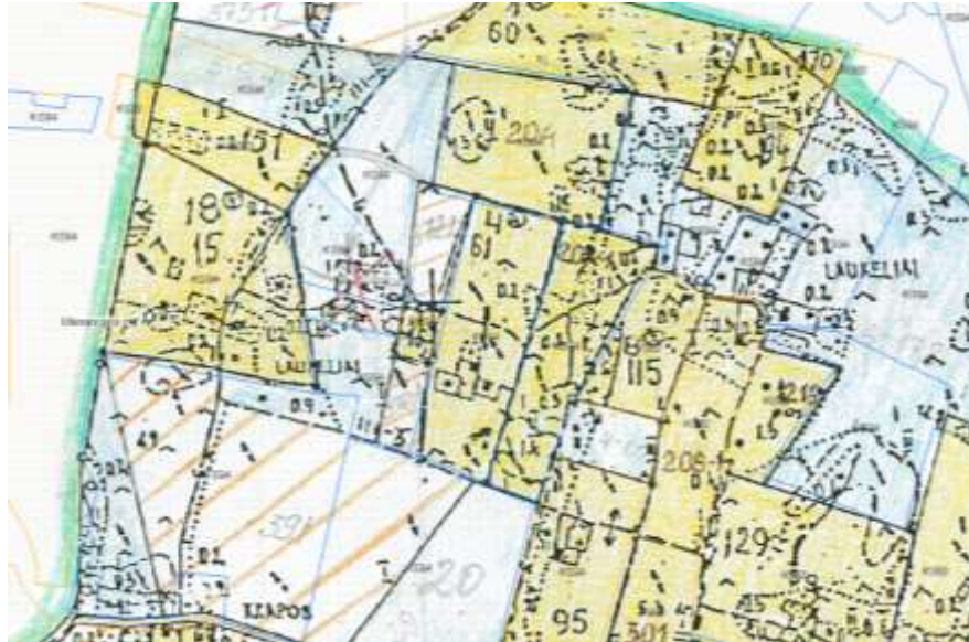
4 pav. Ištrauka iš Želvos k.v. žemės reformos žemėtvarkos projekto