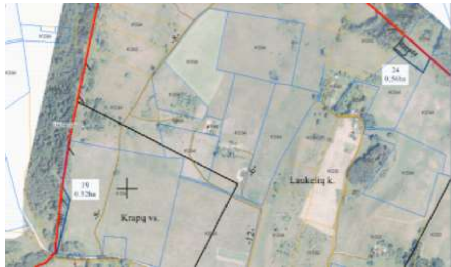
5 pav. Ištrauka iš paskiausiai patvirtino Želvos k. v. žemės reformos žemėtvarkos projekto